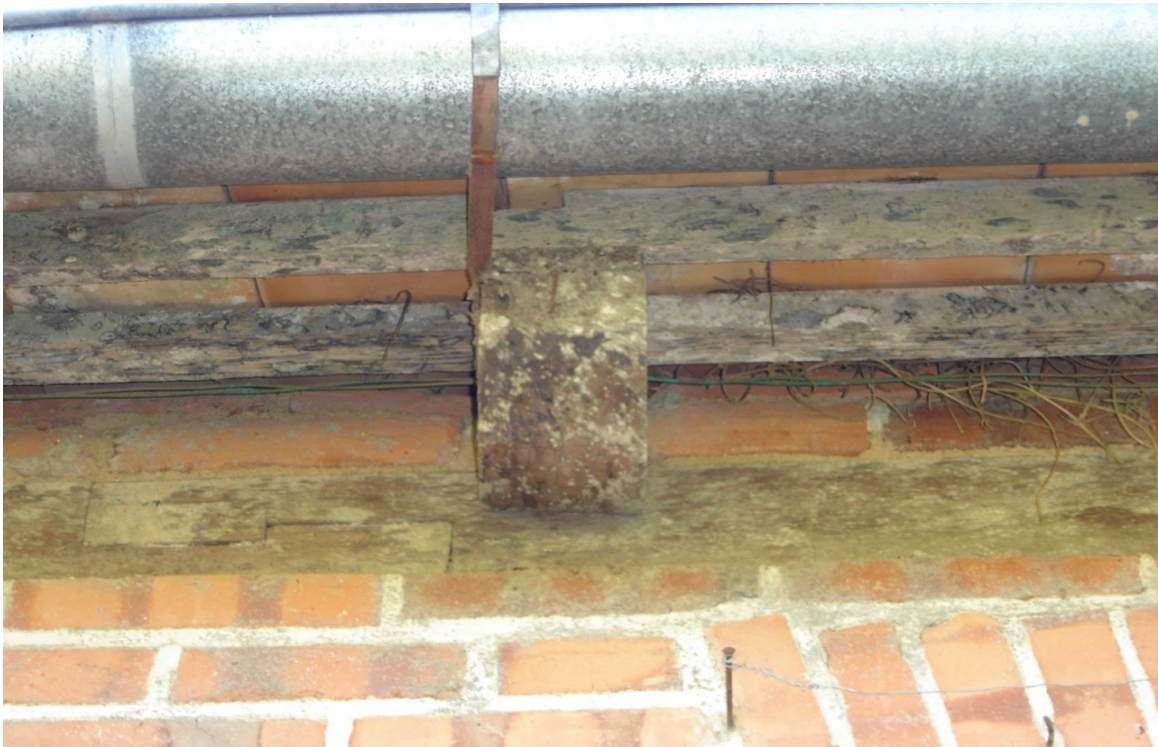
DETALHE DO BEIRAL