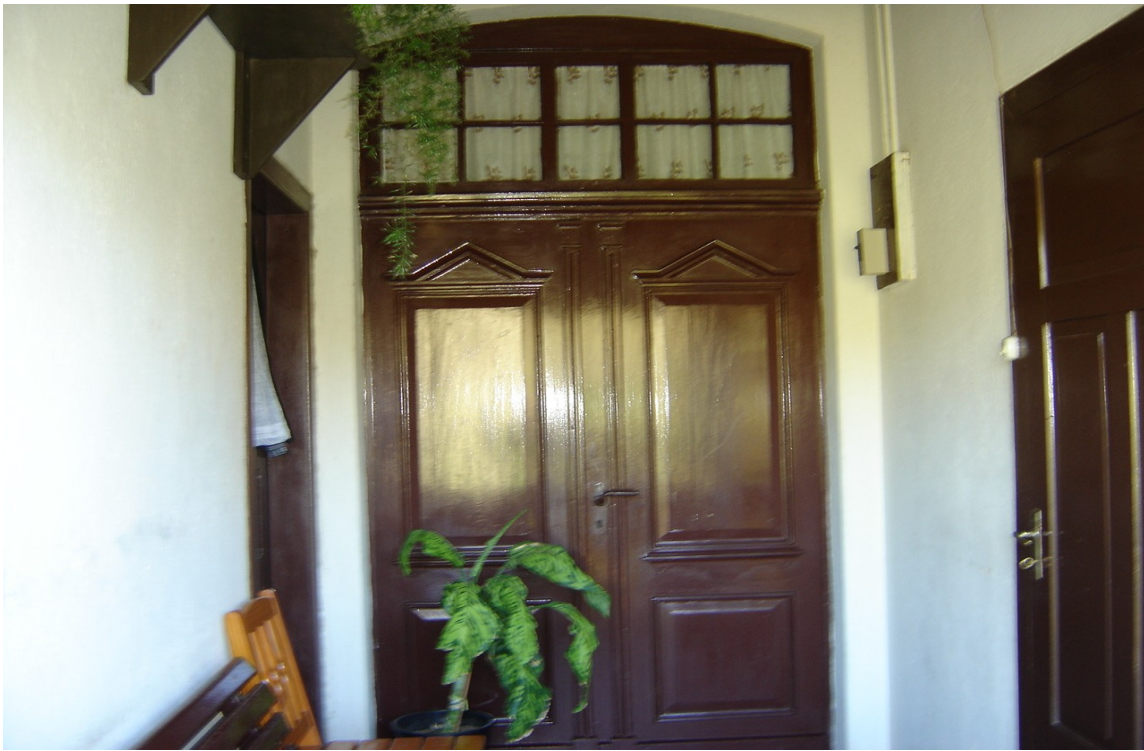
DETALHE DA PORTA DE ENTRADA